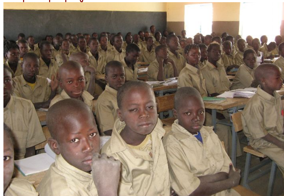
Une classe de 6°, comportant 128 élèves, avec 4 élèves par banc

Le principal projet soutenu est la SCOLARISATION.