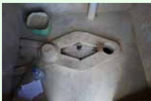
Intérieur de la latrine