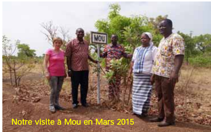
Notre visite à Mou en Mars 2015

Dans le cadre du partenariat avec l'Association d'Entraide des Photographes du Houet ( AEPH) de Bobo-Dioulasso nous avons organisé une collecte d'appareil photos argentiques. Cette collecte a été un succès. Nous avons pu ainsi remettre à nos amis Burkinabé une douzaine de boîtiers argentiques 24x36 avec de nombreux accessoires (flash, objectifs, sacs)