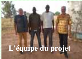
L'équipe du projet

ECO comme écologie et SAN comme santé, notre projet de construction de latrines du type ECOSAN repose sur les deux grands principes de l'écologie et de la santé.