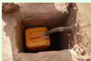
Bidon de récupération des urines