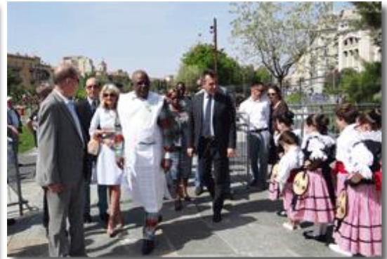
La délégation, l'Ambassadeur de France, le Consul