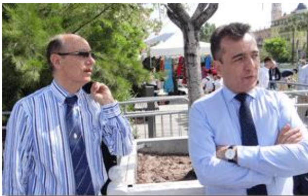
M. X. Lapeyre de Cabanes, le Consul