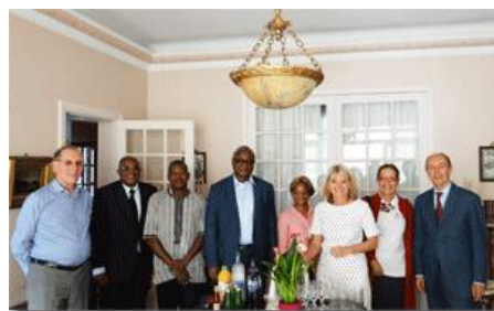
La délégation à la résidence