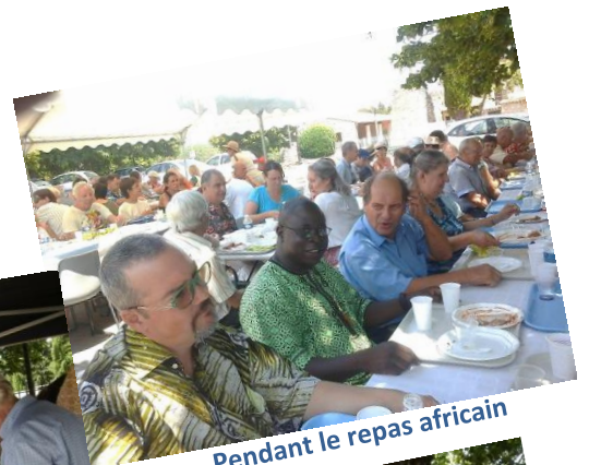
Pendant le repas africain