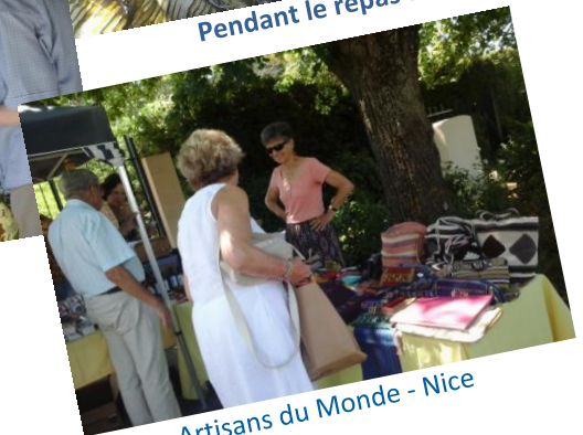
Artisans du Monde - Nice