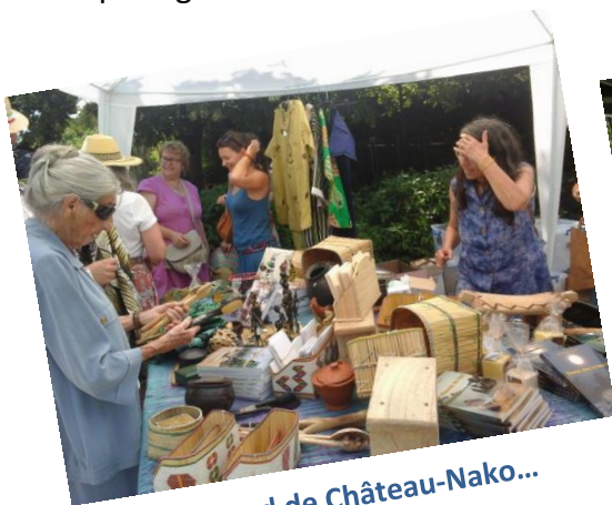
Le stand de Château-Nako...

Merci à tous ceux qui ont contribué à cette joie d'être ensemble et d'en partager les vraies richesses !