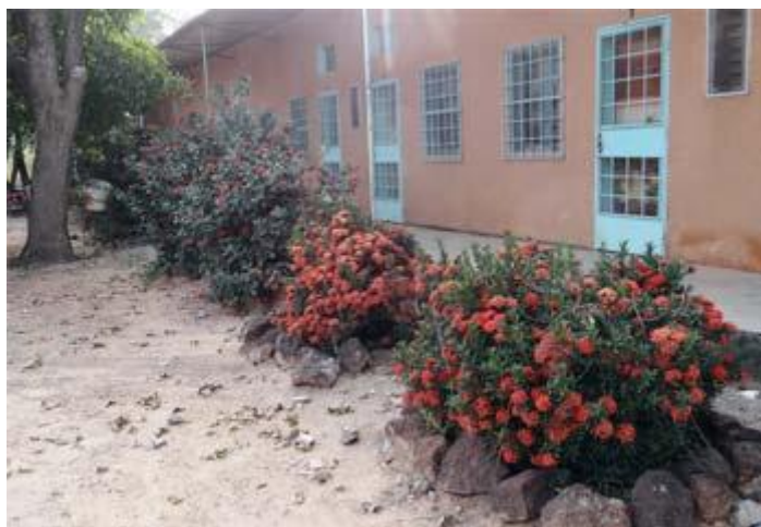
Un des bâtiments