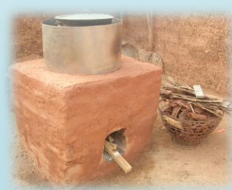
Cuiseur Cantine "Kouminto"