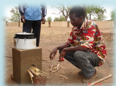
Cuiseur "D'Keng Taoré"