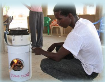
Cuiseur "Bolivia Inti Sud Soleil"

La sensibilisation à la déforestation consiste à faire prendre conscience du peu de rentabilité calorifique d'un foyer traditionnel "3 pierres", donc de sa grande consommation de bois. Nous proposons aux familles Burkinabè de le remplacer par un "foyer à bois économe" du type de celui diffusé par l'association "Bolivia Inti Sud Soleil" http://dkengtaore.org/ . Face à la difficulté de financement de ce matériel, nous avons lancé une fabrication de cuiseurs, utilisant le même principe, mais fabriqués en "béton local" en se heurtant cette fois-ci à 2 inconvénients : toujours les difficultés de financement, mais aussi, si notre prototype réalisé en France avec un bon béton fonctionne à merveille, ce n'est pas le cas du "béton local" qui éclate rapidement à une certaine température. Nous poursuivons le projet en subventionnant l'implantation de "fours cantines", mis au point par l'association "Kouminto" http://www.collectifburkina-dag.fr/energies.htm dans les collèges et écoles primaires, toujours sur le même principe de fonctionnement, en espérant que la sensibilisation sera plus performante en passant par les enfants plutôt que leurs parents