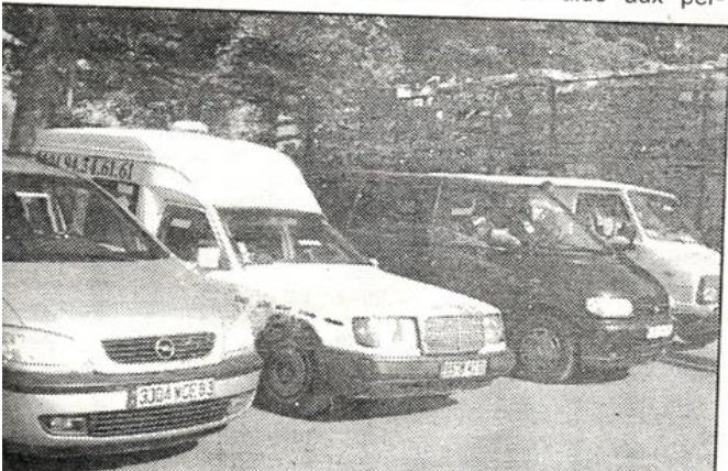
4 voitures, dont une ambulance vont soulager la souffrance