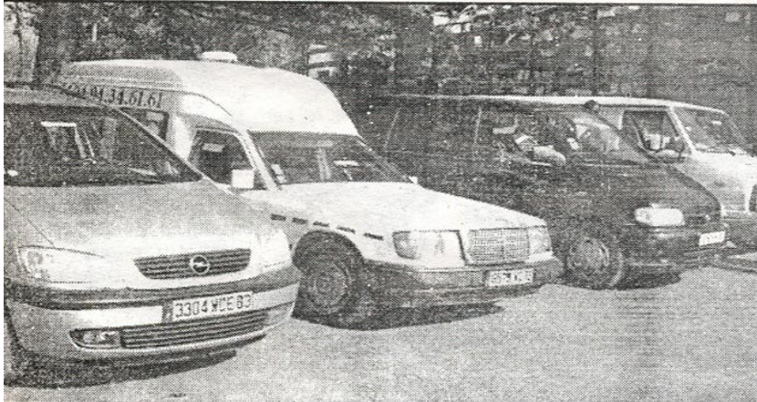
Ces 4 voitures, dont une ambulance vont soulager la souffrance de plusieurs Burkinabé.