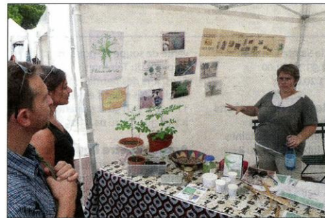
Une cinquantaine de stands associatifs et de produits burkinabés étaient installés ce samedi.