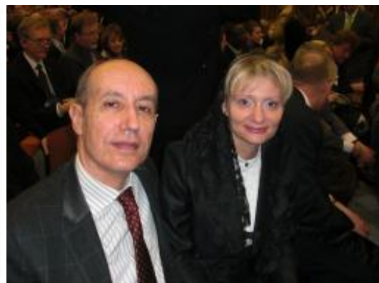
Le Consul et Madame