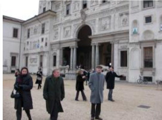
Frédéric Mitterand, directeur de la Villa Médicis Le Consul devant la villa Médicis