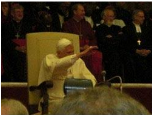
Sa Sainteté, le Pape Benoît XVI